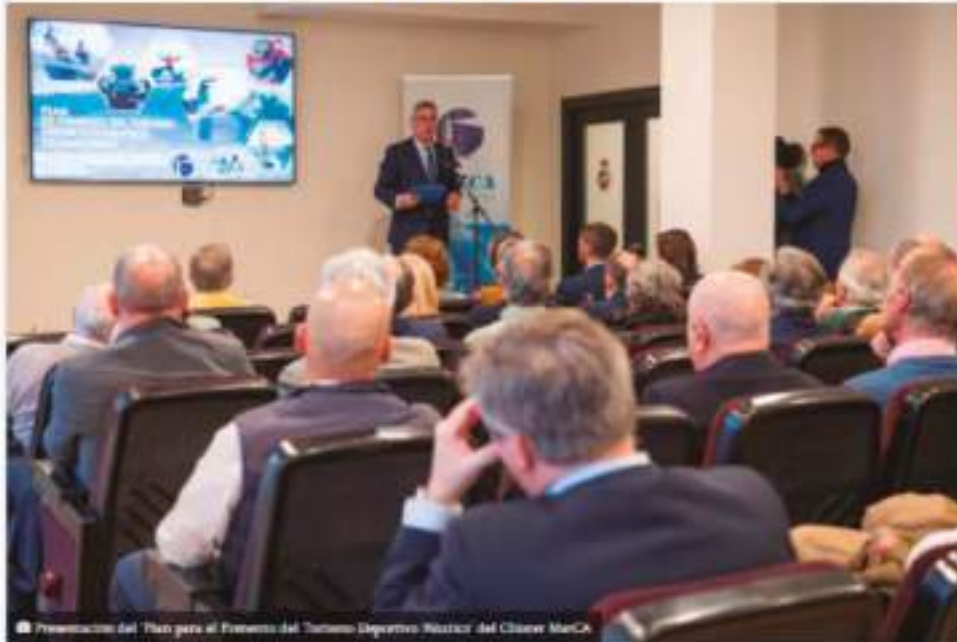
Presentación del 'Plan para el Fomento del Turismo Deportivo Náutico' del Clúster MarCA.

El Clúster Marítimo de Cantabria – MarCA ha elaborado un 'Plan para el Fomento del Turismo Deportivo Náutico' con más de una veintena de propuestas destinadas a impulsar los deportes que se practican en el mar y el turismo asociado a ellos.